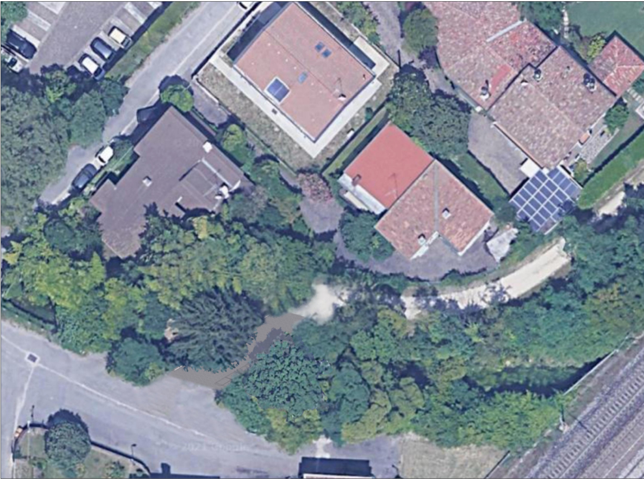
FOTOINSERIMENTO STATO DI PROGETTO - VISTA AEREA